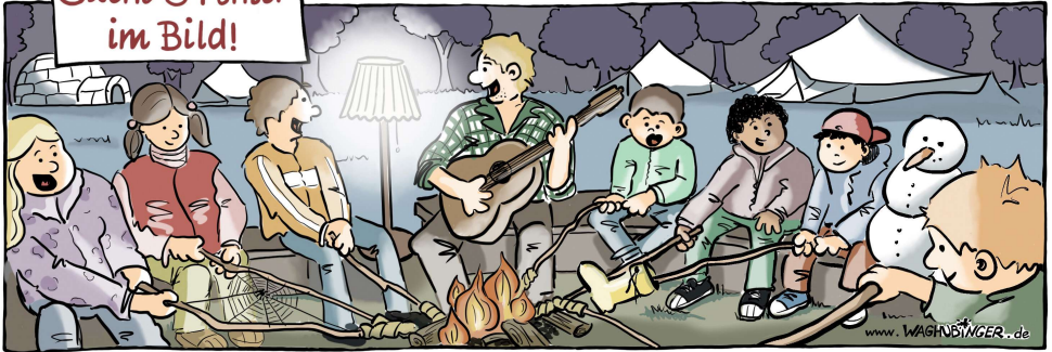
Iglu, Spinnweb, Lampe, Stiefel, Schneemann